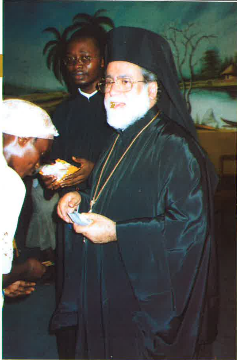
Τοῦ Μακαριστοῦ Πατριάρχου Πέτρου αἰώνια ἡ μνήμη.

Τό παρήγορο εἶναι, ὅτι ὁ Νέος Πατριάρχης κ.