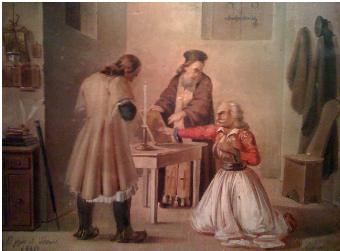
Ο όρκος Ελαιογραφία του Δ. Τσόκου (1849)