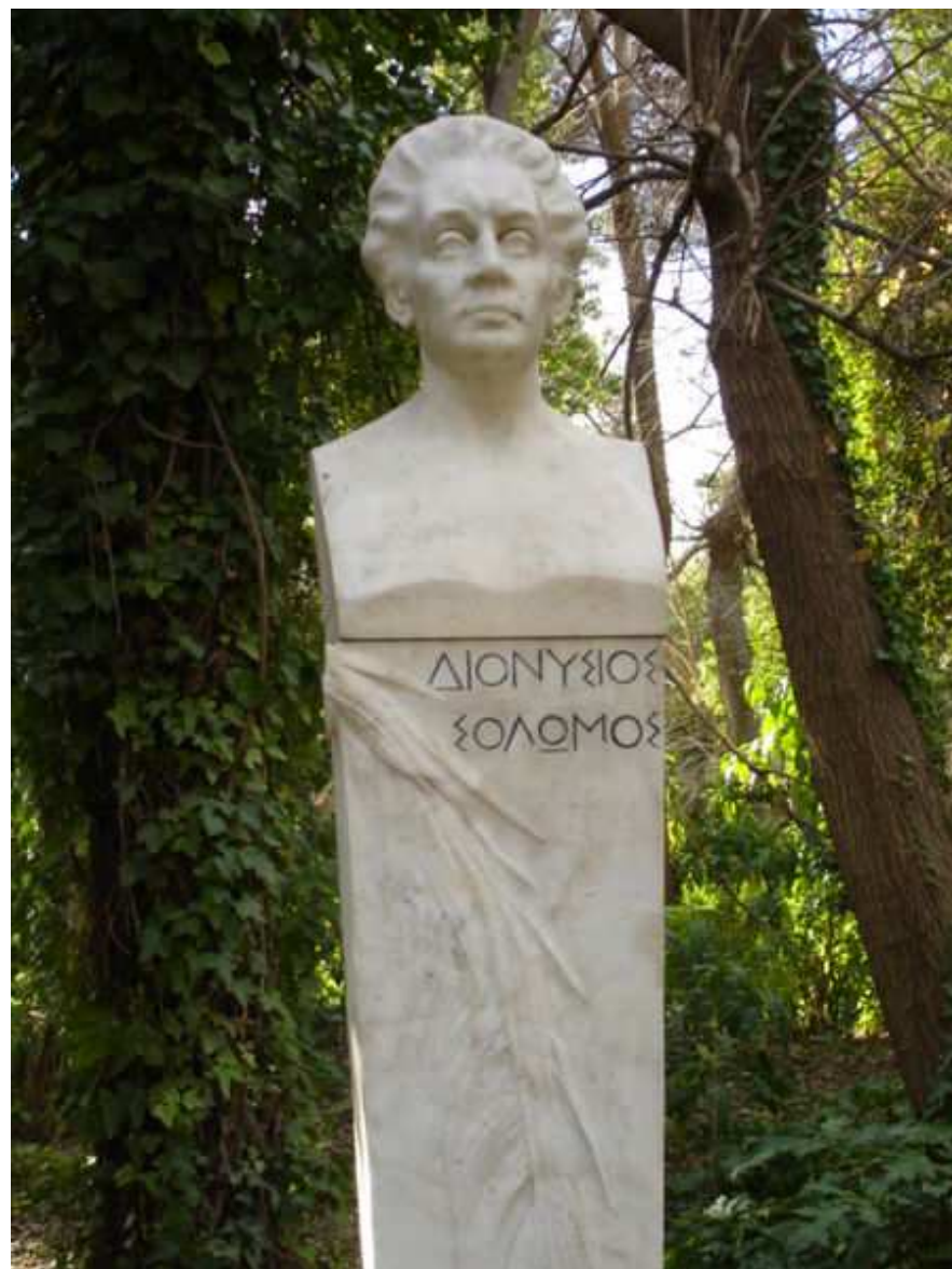
Η μαρμάρινη προτομή του Διονυσίου Σολωμού, που βρίσκεται στον Εθνικό κήπο