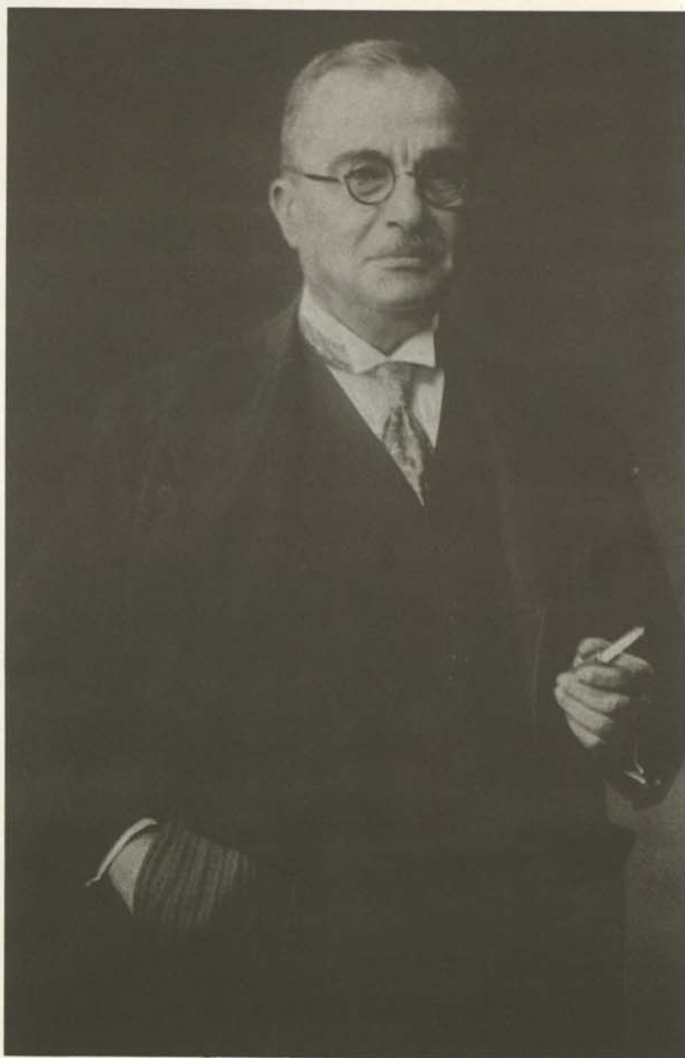
Ο Ιωάννης Μεταξάς.

συντριβή από το κίνημα του 1909, και β) του Φιλελευθέρου κόμματος, του οποίου αυτός ήταν άρχηγός. "Όπως γράφει, «Κατά την βασιλική πολιτική, η Έλλάς κουρασμένη ήδη εκ των Βαλκανικών Πολέμων, έπρεπε να μείνη ουδέτερη και να μη μετάσχη ενός τόσο τρομερού πολέμου, δια να διατηρήση αθανάτους τās δυνάμεις της». Αντιθέτως «κατά την πολιτικήν του Κόμματος των Φιλελευθέρων θά ήταν ιστορικόν έγκλημα να μη μετάσχη εις τόν πόλεμον από τόν όποιον θά εκρίνετο ή τύχη όλων των χωρών επί των οποίων εξετεινόντο αι έθνικαί μας διεκδικήσεις». Με άλλους λόγους, κατά τόν Βενιζέλο τὸ Βασιλικὸ Κόμμα ήταν ειρηνόφιλο και τὸ Βινεζελικό φιλοπόλεμο.