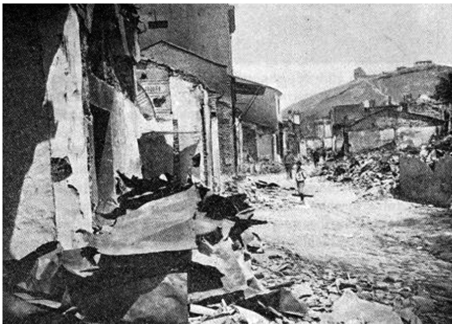
Ερείπια μετά την πυρκαγιά των Σερρών (η φωτογραφία από την Έκθεση της Επιτροπής Carnegie). Στο βάθος διακρίνεται ο λόφος του «Κουλά».

και γ) τον μαρτυρικό θάνατο ανωτάτων λειτουργών της θρησκείας (Μητροπολιτών, Επισκόπων κ.ά.).