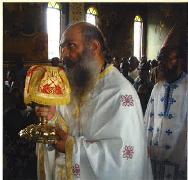
Στόν ‘Ι. Ν. ‘Αγ. ‘Ανδρέου Κανάνγκα οί ιερείς μεταδίδουν «Σώμα και Αίμα Χριστού».

Βλέποντας τό έργο του και γνωρίζοντας τόν άγώνα, τήν άγάπη και τήν άφοσίωσί του στήν διάδοσι τῆς ‘Ορθοδοξίας δέν έχουμε τίποτε άλλο νά κάνουμε, αλλά μόνο ύπακοή στίς τελευταίες λέξεις του: «Χτυπάτε τίς καμπάνες τῆς ‘Ορθοδοξίας σέ όλη τήν ‘Αφρική».