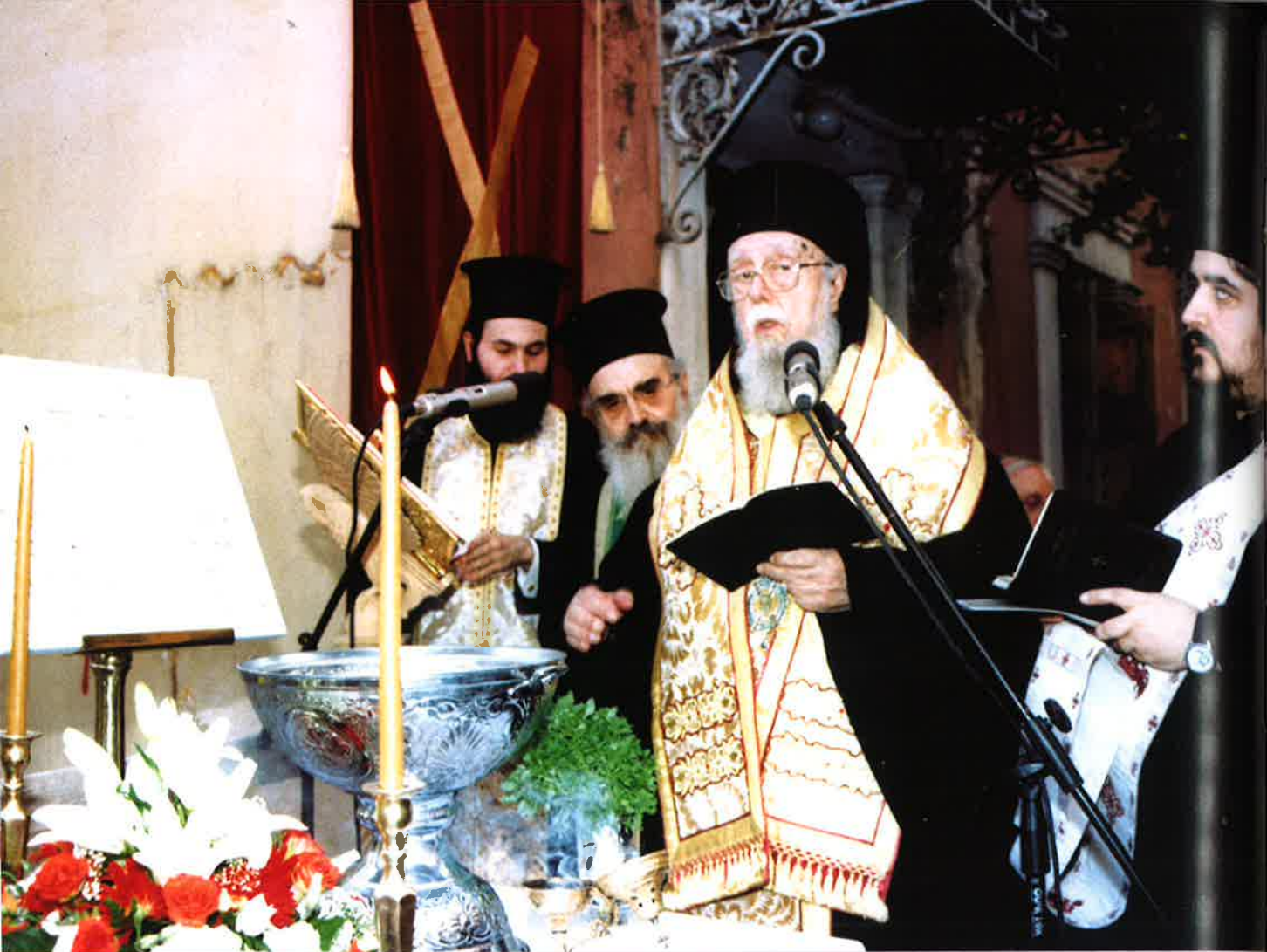
Ὁ Μακαριστὸς Μητροπολίτης π. Πατρῶν Νικόδημος τελεῖ ἀγιασμόν γιὰ τὴν θεμελίωσι τοῦ Ναῦδρίου τοῦ «Πρωτοκλήτου»

Γιὰ τὸν ἀοίδιμον Μητροπολίτη πρώην Πατρῶν κυρὸ Νικόδημο ἔχουν γραφεῖ πολλὰ καὶ ἀπὸ διάφορες προσωπικότητες πού ἐπισημαίνουν τὴν ἐκκλησιαστική, συγγραφική καὶ κοινωνική του προσφορά.