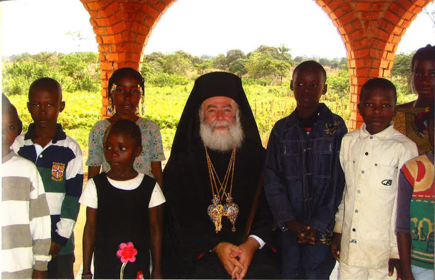
‘Ο Μακαριώτατος Πάπας και Πατριάρχης Ἀλεξανδρείας και πάσης Ἀφρικής κ.ΘΕΟΔΩΡΟΣ Β΄ ανάμεσα στά ὄρφανά τοῦ Ντολιζί τά ὅποια βρῆκαν θαλπωρή στό Ὁρφανοτροφεῖο «Ἅγιος Εὐστάθιος» τῆς Ἱεραποστολῆς μας.

ἄφρικανικό γεώργιο, κατά τό παράδειγμα τοῦ μακαριστοῦ γέροντος.