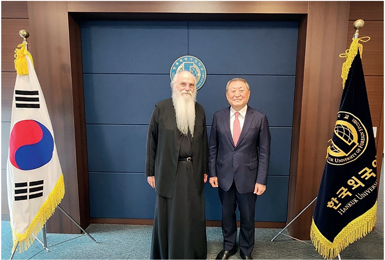
Ο Σεβασμιώτατος μητροπολίτης Μεσογαίας και Λαυρεωτικής Νικόλαος με τον πρύτανη του Πανεπιστημίου HUFS κ. Jeong-Woon Park στην N. Κορέα